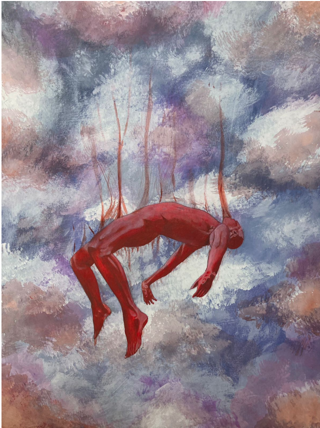
“Aceptación” Técnica: Acrílico